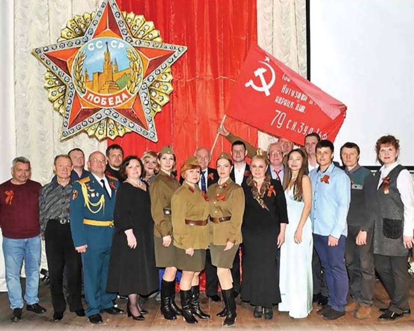
«Победный май», Саров