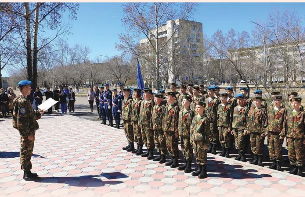
Церемония по приведению юнармейцев к торжественной клятве, Краснокаменск