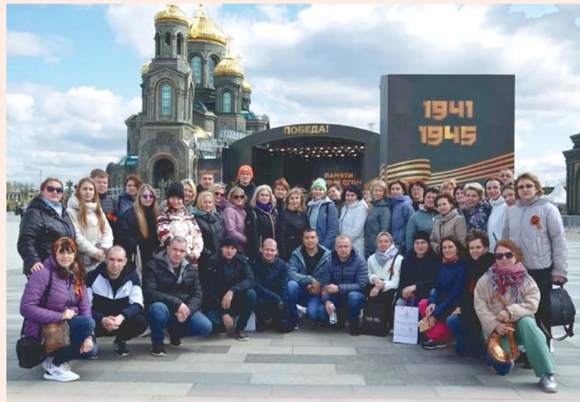
Курские атомщики в парке «Патриот»