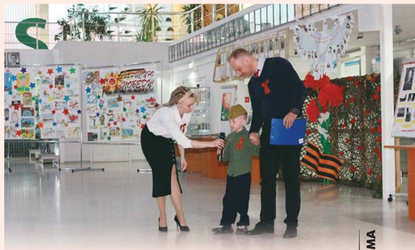
Песенно-поэтический марафон, ЭХП, Лесной