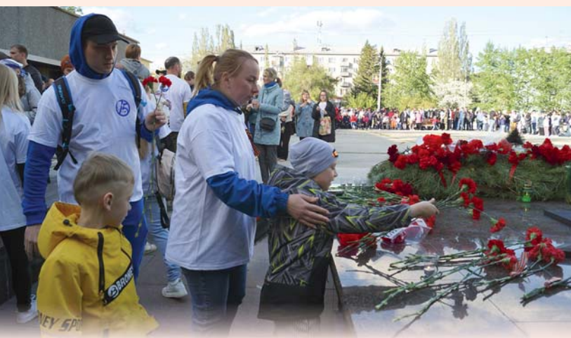
«Вечерняя зоря», Озерск