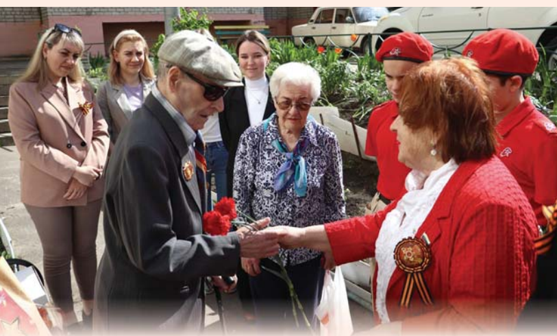
Встреча с ветераном, НВАЭС, Нововоронеж