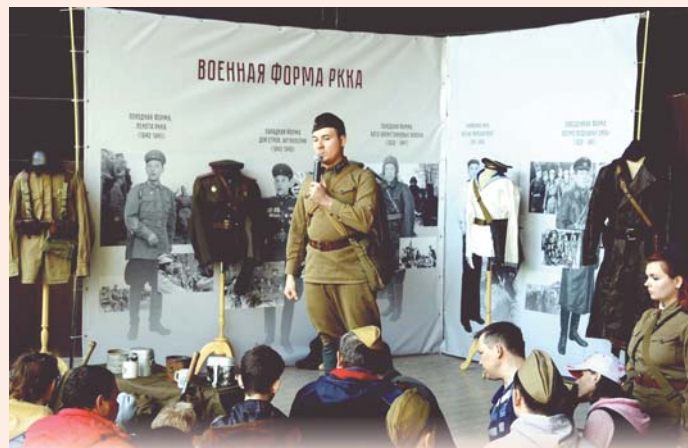
«Весна Победы», Балаково

Около пяти тысяч балаковцев посетили грандиозный праздник «Весна Победы», который на территории парка