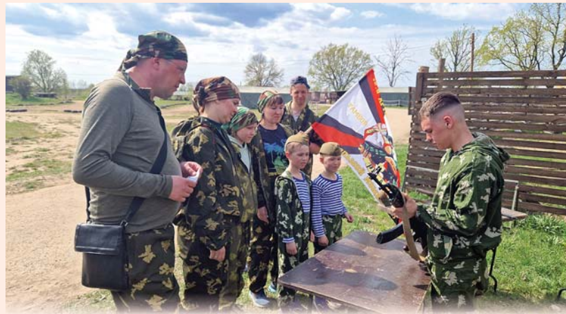
«Зарница», «Атомпроект», Ленинградская область

– Очень впечатлила красота и мощь храма Вооруженных сил России. В нем все пронизано патриотизмом, каждая деталь огромного собора несет глубокий смысл. Главный купол выполнен в виде шлема Александра Невского. Его размер – 19,45 метра – символизирует год Великой Победы. Надолго запомним мы и «Дорогу памяти», которая олицетворяет 1418 дней Великой Отечественной войны. Каждый из нашей группы про-