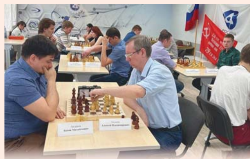
Шахматный турнир, НИИИС, Нижний Новгород

«Стальной Десант» – это большой танковый парк, выставка военной техники времен Великой Отечественной войны. Все экспонаты восстановлены, они являются участниками ежегодных парадов на Дворцовой площади. Также в парке есть образцы более современных БТР и разнообразных орудий, гости могут их посмотреть, потрогать и даже прокатиться на танке. В парке проводятся реконструкции боев, танковых сражений, которые помогают понять, какими усилиями была достигнута Победа.