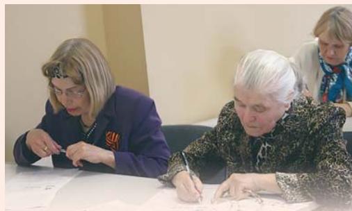
Диктант Победы, НЗХК, Новосибирск