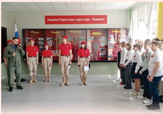
Экспозиция «Чтобы помнили», Нововоронеж